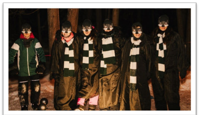
Académie des loups