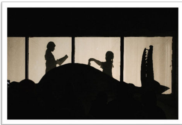
L'opération du loup (théâtre des ombres)